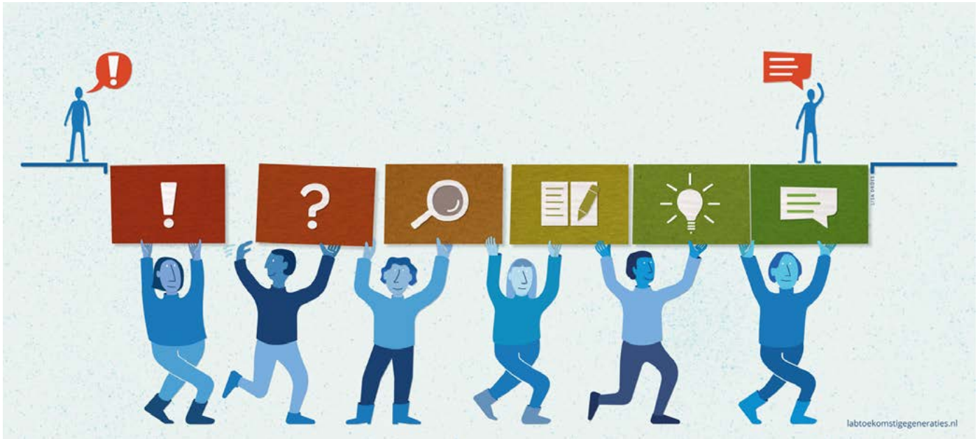
Figuur 1. De weg van de kwestie